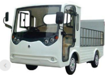
Xe tải điện 02 chỗ ngồi (LT-S2.BHY6)