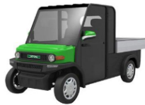
Xe tải điện 02 chỗ ngồi (LT-S2.DCH)