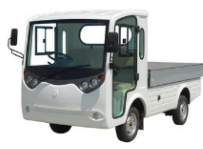
Xe tải điện 02 chỗ ngồi (LT-S2.B.HP)