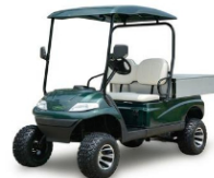
Xe tải điện 02 chỗ ngồi (LT-A627.H8G)