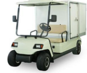
Xe tải điện thùng kín 02 chỗ ngồi (LT-A2.GC)